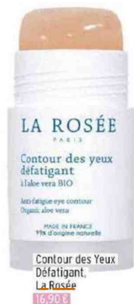
Contour des Yeux Défatisant, La Rosée 16,90 €

Puisqu'il ne nous reste que ça à montrer, autant le soigner ! Zoom sur 5 techniques qui nous font de l'œil pour un regard lumineux au naturel ! Marine Boisset