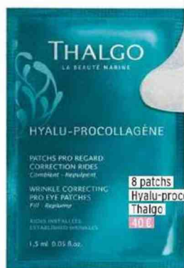
8 patches Hyalu-procollagène, Thalgo 10 €