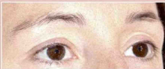
Soin Lift Brow, theure, Les Cils de Marie 130 €